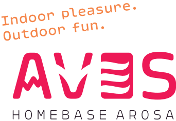
Logovariante + Claim